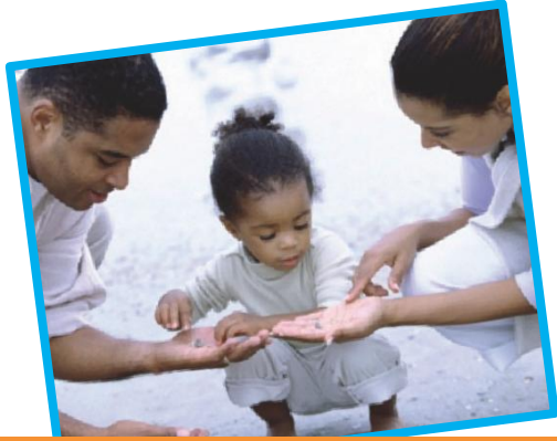
เก็บ และ นับ เปลือกหอย