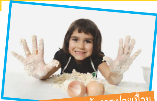
ทำอาหาร สนุกกับการเปอะแป้ง