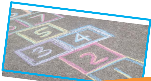
วาดและเล่นดังเต

แผ่นพับนี้สามารถจัดทำขึ้นได้ในรูปแบบ อื่นๆ