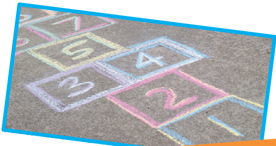
കക്കു കളി (ഹോപ്പ്കോച്ച്) വരക്കുകയും കളിക്കുകയും ചെയ്യുക

ഈ പത്രിക മറ്റു മാത്രകളിലും ലഭ്യമാക്കാൻ പറ്റും വിളിക്കേണ്ട നമ്പർ 01803 208149