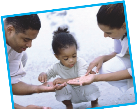
പുറംതോട് ശേഖരിച്ചു എണ്ണി പഠിക്കുക