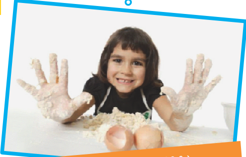
പാചകം ചെയ്യും അലക്കോലമാകും