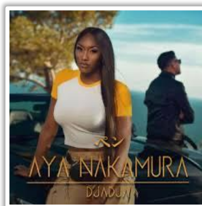
A very catchy song...

The lyrics are mainly in suburban slang and a little controversial, but the song became a protest anthem for the French Me-too movement as they are about a girl who refuses to be put down and belittled. Read them here.