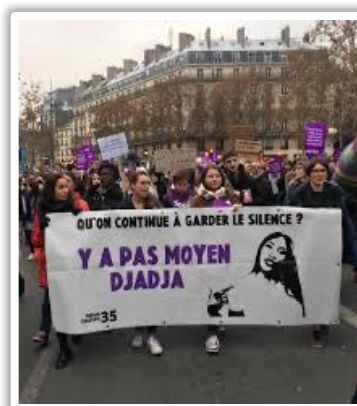
Her lyrics were slogans in feminist marches